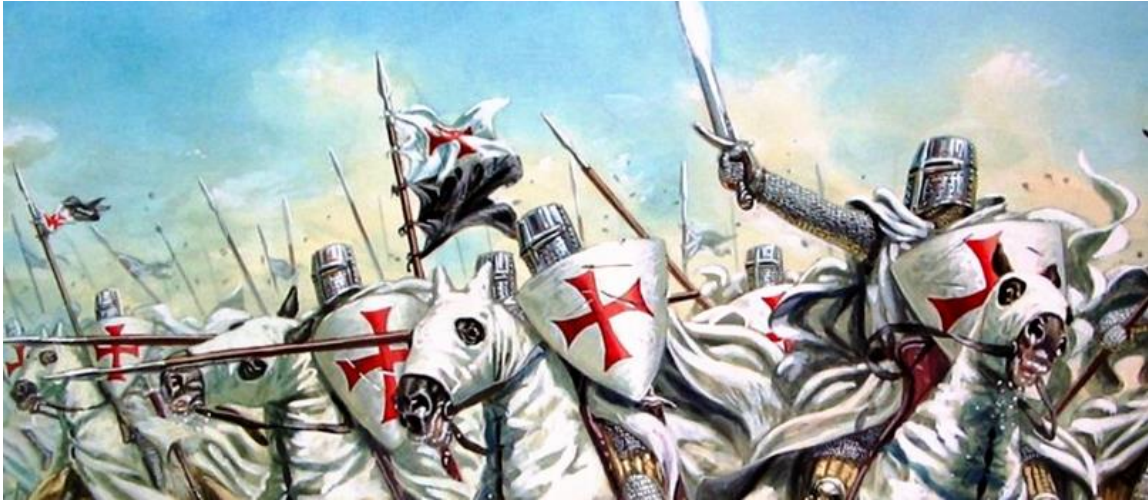
Representação dos cruzados

Apesar da prosperidade iniciada no século XI, no século XIV ocorreu uma grande crise, gerada pela fome, pela peste e pela guerra, que fez com que a curva demográfica caísse drasticamente.