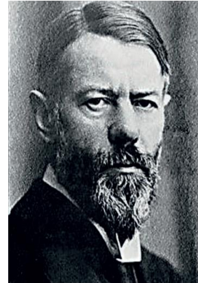
(3) Max Weber (1846-1920)

Sobre o objeto de estudo elaborado por esses teóricos, é CORRETO afirmar que