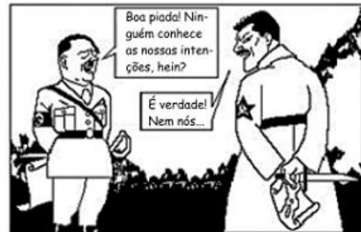
DOIS BONS CAMARADAS Belmonte

(BELMONTE. Folha da Noite, 22 set. 1939. In: Caricatura dos Tempos)