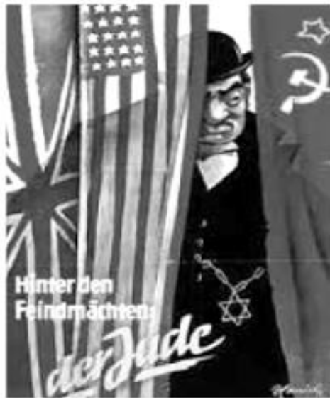
"Por trás das potências inimigas: o judeu" Adaptado de advertisingarchives.co.uk .