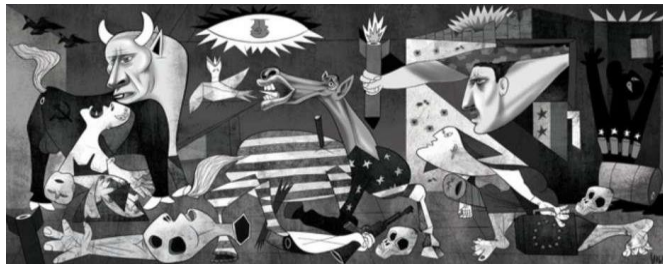
(Guernica – Pablo Picasso)