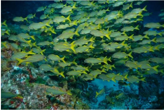
Cardume de peixes, em gregarismo, que muitas vezes ajuda a escapar dos ataques de predadores.

Gregarismo (+,+): Indivíduos da mesma vivem juntos, porém sem ligações anatômicas ou sem hierarquia social. Esse aglomerado ajuda na proteção da população, seja para enganar predadores, confundi-los ou mesmo assusta-los, como por exemplo grandes cardumes ou manadas.