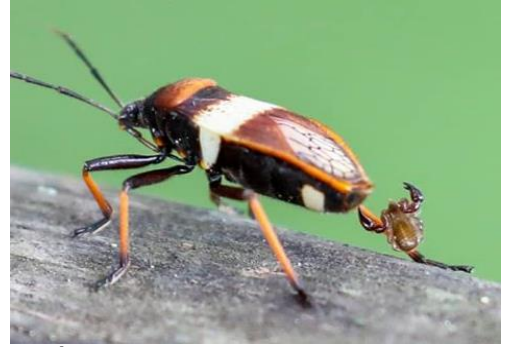
Ácaro preso na pata de um inseto Hemíptero, sem causar danos, para ser transportado por foresia.

Foresia (+,0): São quando organismos utilizam outros para sua locomoção, sem atrapalhar a movimentação ou causar qualquer prejuízo a eles. São exemplos alguns ácaros e carrapatos, que se prendem em pernas de insetos para serem transportados, e também sementes com que se prendem no pelo ou penas de animais, sofrendo dispersão para outros locais.