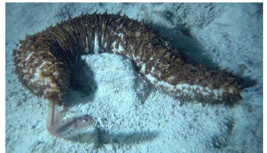
Peixe agulha vivendo dentro de um pepino do mar. A presença deste peixe não afeta negativamente o pepino do mar.

Quando se trata de plantas, chamamos essa relação de epifitismo, onde uma planta fica sobre galhos de outras para conseguir mais luz. Dentre os exemplos podemos citar as bromélias e as orquídeas.