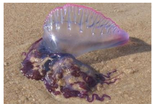
Caravela-portuguesa, exemplo de colônia heteromórfica, flutuando no mar.

Colônia (+,+): Indivíduos da mesma espécie são anatomicamente ligados, formando uma nova entidade. Os indivíduos podem apresentar organismos idênticos e que desempenham a mesma função (colônias isomorfas, como os corais e bactérias) ou com forma e funções diferentes (colônias heteromórficas, como a caravela-portuguesa, um Cnidário).