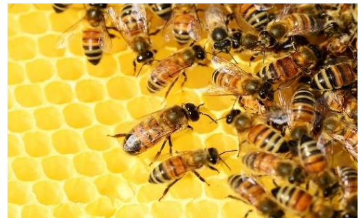
Os insetos Himenópteros, como as abelhas e as formigas, são exemplos de animais que vivem em sociedade.

Sociedade (+,+): São organismos que vivem juntos, sem serem anatomicamente ligados, porém apresentam uma hierarquia, com divisão de trabalho. São exemplos as abelhas, com a divisão de trabalhos na colmeia com a abelha rainha, o zangão e as abelhas operárias.