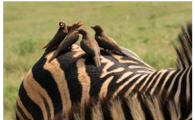
Pássaros que comem carrapatos de outros animais são um exemplo de protocooperação, pois estas aves conseguem alimentos e os animais ficam livres dos parasitas.

Protocooperação (+,+): Indivíduos de espécies diferentes se relacionam em benefício mútuo, porém não é uma relação obrigatória, ou seja, separados, eles conseguem sobreviver. Pode ser considerado por alguns autores como um tipo de mutualismo facultativo . Dentre alguns exemplos temos o pássaro-palito, conseguindo alimento dos restos na boca de um crocodilo, e o crocodilo se beneficia ficando com menos bactérias e problemas bucais. Outro exemplo seria o crustáceo paguro com uma anêmona em sua concha: a anêmona consegue mais alimento pois há uma maior correnteza de água passando conforme o paguro anda, e o paguro recebe proteção da anêmona, por conta de seus tentáculos urticantes.