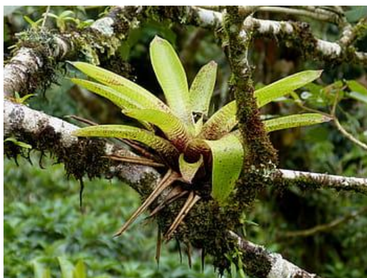
Bromélia epífita sobre um tronco de árvore.