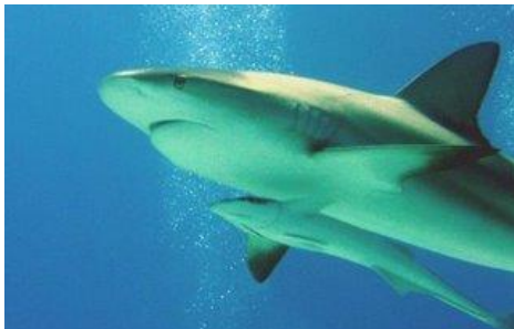
As rêmoras que comem resto de comida de tubarões indicam uma relação de comensalismo

Comensalismo (+,0): Um dos indivíduos envolvidos é beneficiado, enquanto o outro não recebe nem benefícios nem malefícios, sendo indiferente para ele. Um dos exemplos é o tubarão e as rêmoras, onde o tubarão se alimenta normalmente, e o resto da comida é ingerido pelas rêmoras e outros peixes que nadam próximo. Outro exemplo seria dos leões e das hienas. Os leões, após comerem, abandonam a carcaça, e as hienas vão e se alimentam deste resto do animal.