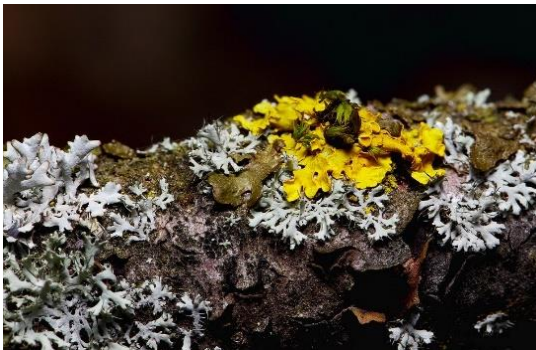
Líquens representam uma associação mutualística entre fungos e algas ou cianobactérias

Mutualismo (+,+): Indivíduos de espécies diferentes se relacionam de maneira obrigatória, e ambos são beneficiados. Ou seja, sozinhos, esses indivíduos não sobrevivem. São exemplos os líquens, onde alga ou cianobactérias fornecem matéria orgânica ao fungo, que dá sais minerais e gás carbônico em troca. Os ruminantes também são animais que vivem em mutualismo com as bactérias que digerem celulose, presentes em seu estômago.