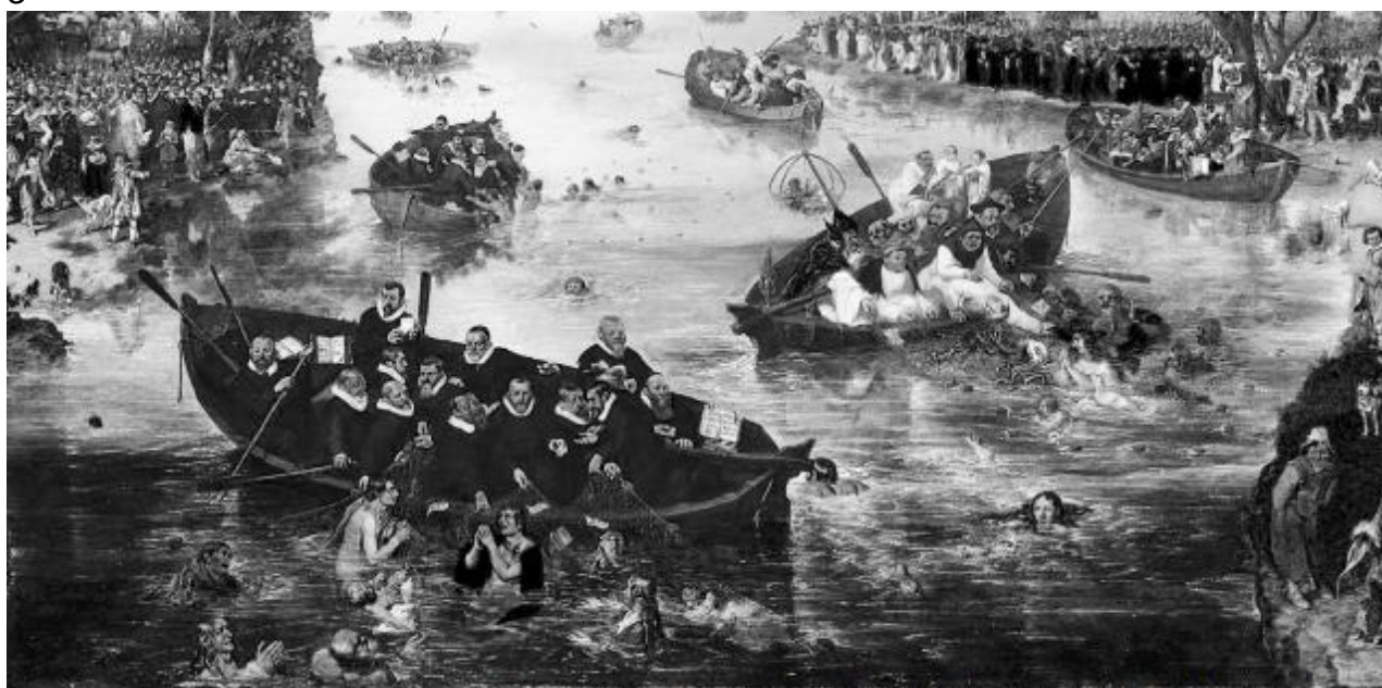
Adriaen van de Venne. A pesca de almas (1614). Rijksmuseum, Amsterdã, Holanda. Detalhe.