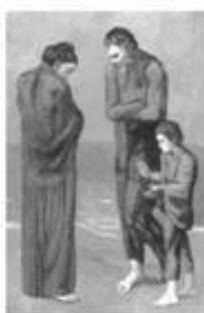
Os pobres na praia