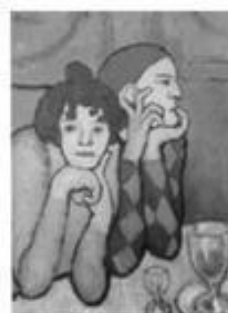
Os dois saltimbancos